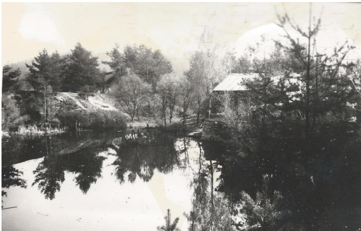
Lišínské jezírko, později "Jezerní kotlina."

K velkým dobrodružstvím sváděl i komplex lískami zarostlých roklí, blízkosti lesů, řeky a vůbec přírody kolem města.