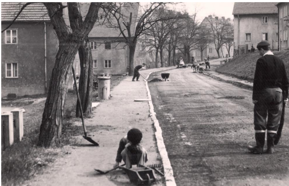
Husova ul. padesátých let

Narodil jsem se 23. 9. 1947 v Aši a asi osudem mi bylo určeno, že jsme se v roce 1949 přestěhovali do Holýšova – Horní ulice a po několika měsících o pár ulic stejného města níže a to do ulice Husovo. No snad každý pochopí, že z toho si nic nepamatuji.