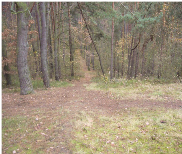
"Mamuťák" na "Višňovce."

Zatím náš dětský život probíhal ve hrách na vojáky. Láďa vždy každému vymaloval krásné výložky, které jsme si přišpendlili na ramena. Na mne bohužel vyšly vždy jen výložky vojína, ale i tak jsem byl rád. Ostatním se vždy podařilo získat nárameníky od staršiny výše. Přípravy scénáře – boje proti Němcům – se domlouvaly vždy cestou na Višňovku a do lesa. Každý dostal nějakou tu úlohu, jen na mne vždy padlo: „Zastřelen, nebo zraněn při prvním útoku Němců“. Tuhle roli jsem vždy bravurně sehrál a tehdy mě vůbec nenapadlo, že jsem byl z boje vyřazen proto, abych tyhle války nějak jinak nekazil.